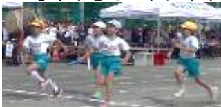
つなげ!心のバトン!!