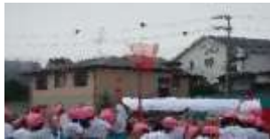
1年フレフレ玉入れ