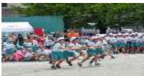
3年ミラクルハリケーン