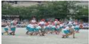
5・6年決戦! 仲本の陣