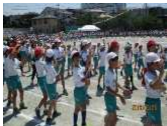
ふれあい浦和おどり