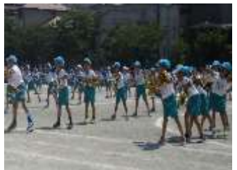
どうぶつむらのカーニバル