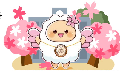
90周年マスコット「なかモコ」