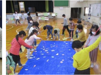
青空プレイランド 体育館