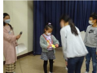
青空プレイランド